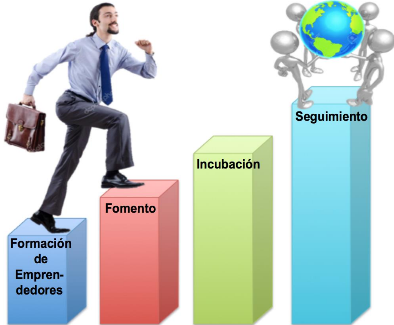
Modelo de emprendimiento universitario